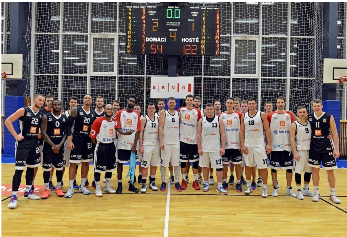
Po utkání Českého poháru T.J. Sokol Šlapanice – ČEZ Basketball Nymburk 17. 11. 2016