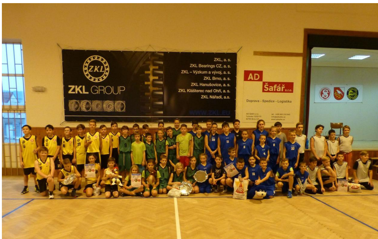
SVATOMARTINSKÝ TURNAJ MINIKŮ – 17. 11. 2016