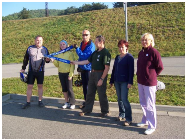
VZPOMÍNKA NA SLETOVOU ŠTAFETU 2011