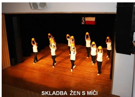
SKLADBA ŽEN S MÍČI