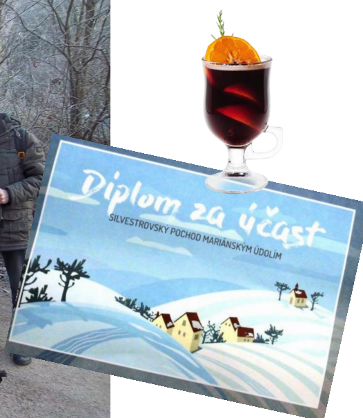
Před startem (ještě nejsme všichni!)