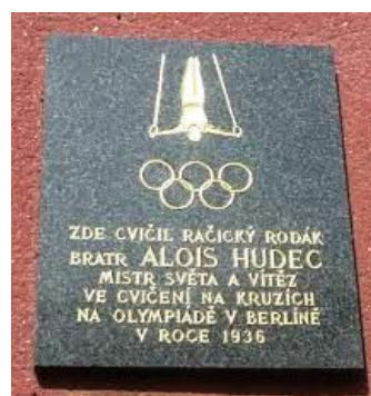
Pamětní deska na sokolovně v Račicích