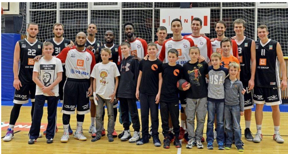
Hostující mužstvo se šlapanickými basketbalovými nadějemi